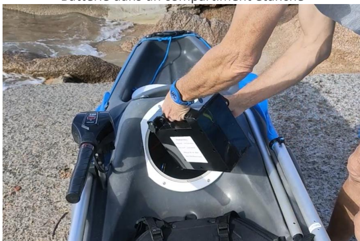
Batterie dans un compartiment étanche