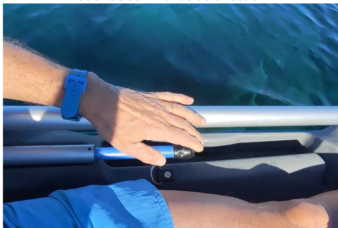
Stick de commande de direction